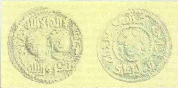
Müstencid-Billâh adına basılmış bir sikke (İstanbul Arkeoloji Müzesi, Teşhir, nr. 1221)