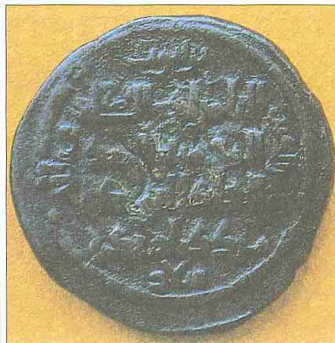
Nâsirüddin Artuk Arslan adına 599'da (1202-1203) basılmış bakır sikke (İstanbul Arkeoloji Müzesi, Teşhir, nr. 1232)