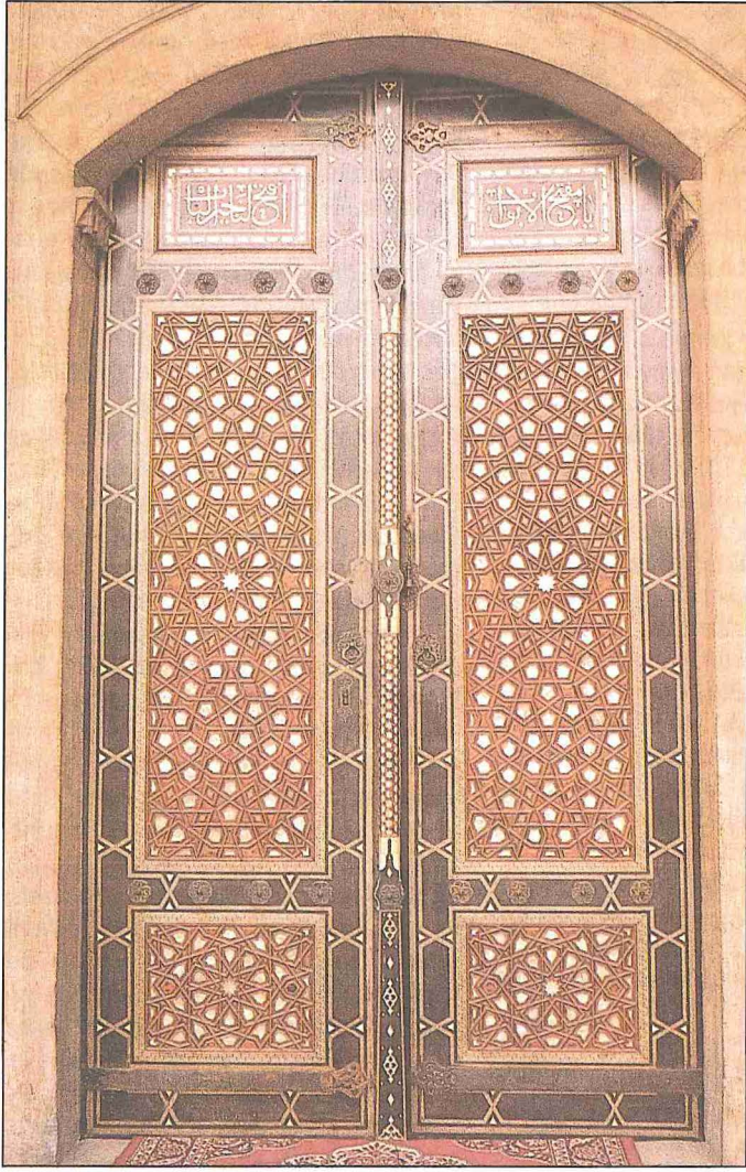
Abanoz bordürlü kapı (I. Ahmed Türbesi- İstanbul)

Abanozun İslâm dünyasında sevilen bir ahşap türü olmasına rağmen yaygın şekilde kullanılması ancak XIII. yüzyıla rastlamaktadır. Daha önceleri adından, tozu göz iltihaplarına ve mide ağrılarına iyi gelen bir tıbbî bitki olarak bahsedildiği görülmektedir. Abanozun İslâm sanatlarında en çok kullanıldığı alan kâmacılıktır. Siyah renginin fildişiyle, sefle ve sarı, kızıl-kahverengi, kırmızı renklerdeki ahşapla sağladığı uyum, bu tür malzemeyle birlikte çekmece, kutu ve tavla, dama-satranç tahtası gibi eşyanın yapım ve tezyininde tercih edilmesine sebep olmuştur. Türk ahşap sanatının en güzel örneklerini vermiş olan Anadolu Selçukluları, ceviz ağacının yanı sıra abanozu da kullanmışlar, fakat ondan tek parça ve oymacılık hünerinin gösterilebileceği rahle ve benzeri eşyadan çok, künde-kârî teknikle çeşitli parçalardan meydana getirilen minber gibi