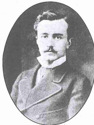
Paris büyükelçiliğinde kâtiplik yaptığı dönemde Abdülhak Hâmîd (1877)

Tanzimat'tan sonraki yıllarda Batı kültür ve edebiyatının tesiri altında ortaya çıkan yeni Türk edebiyatının ikinci nesline mensup olan Abdülhak Hâmîd, yaklaşık dört devri idrak etmiş ve bu süre içinde Türk edebiyatında şekil ve