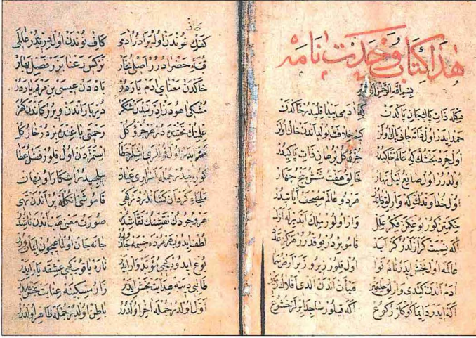
Abdürrahim Karahisârî'nin Vahdetnâme adlı eserinin ilk iki sayfası (10 KÜP, TY, nr. 808)

Tercüme-i Kaside-i Bürde . Hz. Peygamber'in medhi hakkında Bûsîrî tarafından yazılan Arapça kasidenin Türkçe tercümesidir. Eser, İ. Hikmet Ertayan tarafından tıpkıbasım olarak neşredilmiştir (İÜ Edebiyat Fakültesi yayınları, İstanbul 1960). 3. Risâle fi eşrâti's-sâ'a . Kıyametin âlemlerinden bahseden Arapça bir eserdir. 862 (1457) yılında telif edilmiştir. Tek nüshası Süleymaniye Kütüphanesi'ndedir (Fâtih, nr. 5347, vr. 117 b -123 a ). 4. Vahdetnâme . Abdürrahim Karahisârî'nin en önemli eseridir. Sade bir dille ve aruzun remel bahrinde yazılan eser 4250 beyitten meydana gelir. Telif tarihi 865'tir (1460). Şair, tasavvufî esasları basit hikâyelerle açıklamaktadır. Eserde bazı mistik İran şairlerinin ve Âşık Paşa'nın tesirleri açıkça görülmektedir. Muhtelif kütüphanelerde nüshaları bulunan eserin en iyi nüshası İstanbul Üniversitesi Kütüphanesi'ndedir (TY, nr. 808).