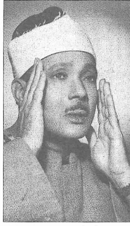
Abdülbaşit Muhammed Abdüssamed

lerin devlet veya hükümet başkanları tarafından çeşitli nişanlarla taltif edildi. Bunlar arasında Suriye devlet başkanı (1956), Fas kralı (1961), Lübnan devlet başkanı, Malezya başbakanı (1965) ve Mısır devlet başkanı (1988) tarafından verilen nişanlar anılabilir.