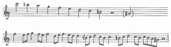
Acem-bûselik makamı dizisi ve seyir örneği

Adına, Nahçıvan'da Mü'mine Hatun Türbesi'ndeki bir kitâbede rastlanmıştır. 582 yılı Muharreminde (1186) yapılmı biten türbenin kapı üstündeki kitâbesinden, buranın Atabegler'den Şemseddin İldeniz tarafından yaptırıldığı öğrenilmektedir (bk. MÜ'MİNE HATUN TÜRBESİ). Bu kitâbede "Acemî bin Ebî Bekr el-Bennâ en-Nahcuvânî" olarak kaydedilen ismin den mimarın veya türbenin çok itinalı ve son derece zengin dış süslemesini yapan ustanın aslen Nahçıvanlı olduğu anlaşılmaktadır. Kitâbeleri okuyan M. Hartmann, "Acemî" adının doğru olarak çözülebildiği hususunda tereddütlüdür. Aynı yerde Kûmbed-i Atâ Baba denilen, kitâbesinde 557 yılı Şevvalinde (1162) yapıldığı belirtilen ve Atabegler'in ileri gelenlerinden Yûsuf b. Kasîr'e (Hartmann'a göre Kusayr) ait türbenin de onun eseri olduğu Ma-yer tarafından ileri sürülmüşse de yayımlanan kitâbede bu hususta bir açıklık yoktur. Bazı kaynaklara göre, Mü'mine Hatun, Şemseddin İldeniz'in zevcesi olmadan Selçuklu Hükümdarı II. Tuğrul Bey ile evli idi. Ancak kitâbenin bazı kısımlarının noksan oluşu yüzünden bu hususlar karanlık kalmaktadır.