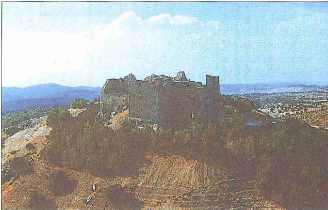
Acilün'un tarihî kalesi