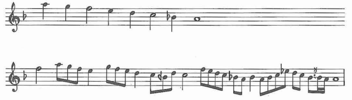
Acem-kürdî makamı dizisi ve seyir örneği

el-İsfahânî'den Begavî'nin Şerhu's-Sünne'sini ve başka hadis kaynaklarını, Abdülhak el-Yüsufî'den de Şâfî'nin İhtilâfü'l-ḥadis'i ile Buhârî'nin et-Târiḫu'l-kebîr'i ni ve diğer çeşitli kitapları dinleyip rivayet etmiştir.