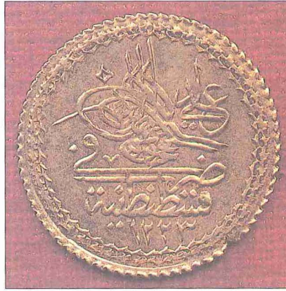
II. Mahmud devrine ait adlî altın (İstanbul Arkeoloji Müzesi, Teşhir nr. 1943)

II. Mahmud'un tahta çıkışının on dördüncü yılında darbedilen ve mahlasına nisbetle "Adlî" adıyla anılan bu sikkeler tam, yarım ve çeyrek olmak üzere üç çeşit idi. 1822 yılında tamı 12, yarımı 6, çeyreği ise 2.5 kuruşa (yüz para) geçiyordu. Daha sonra "atfık adlî" adını alacak olan bu altınlar 19 kırat ayarında idi ve tarife değerleri üzerinden di-