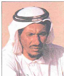
Agel-kefiye takrîs bir Arap

Hîve Hanlığı'nın 1872'de Rus işgaline uğradığı döneme kadar bizzat şahit olduğu olayları yazan Âgehi, aynı zamanda resmî vesikalardan, raporlardan da faydalanmış ve değerli bir kulliyati ortaya koymuştur. Âgehi'nin Hîve hanları tarihiyle ilgili altı eseri vardır: 1. Riyâzû'd-devle . Allah Kulu Han devri (1825-1842) tarihi olup Rahîm Kulu Sultan döneminin ilk iki yılını da içine alır. 2. Zübdetü't-tevârih . Rahîm Kulu Han'ın şehzadelik ve hanlık zamanından bahseder (1843-1846). 3. Câmiu'l-vukûâtî's-sultânî . Muhammed Emîn Han (1846-1855), Abdullah Han (1855) ve Kutluğ Murad Han (1855-1856) devirlerini anlatır. 4. Gülşen-i Devlet . Seyyid Muhammed Han tarihidir (1856-1864). 5. Şâhid-i İkbâl . II. Seyyid Muhammed Rahîm Han'ın saltanatının ilk sekiz yılını ihtiva eder (1864-1872). 6. Firdevs-i İkbâl . Amcası Münis'in başlayıp Âgehi'nin tamamladığı bu eserin Leningrad'da bulunan ve biri müellif nüshası olan iki yazması, karşılaştırmalı olarak, Münis ve Âgehi'nin biyografileri, nüshaların özellikleri, kaynakları ve telif safhalarını ihtiva eden bir girişle birlikte, Yuri Bregel tarafından neşredilmiştir (Şîr Muhammed Mîrâb Münis-Muhammed Rızâ Mîrâb Âgahî, Firdaws al-Iqbâl History of Khorezm , Lei-