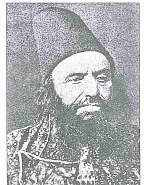
I. Ağa Han Hasan Ali Şah

Ağa Han Hasan Ali Şah Mahallâtî (ö. 1298/1881). Nizârî İsmâîliyye'nin XIX. yüzyıl başlarında "Ağa Hanlar dönemi" diye adlandırılan devresinin ilk imamıdır. Yetişmesinde, sağlam ve mücadeleci bir karakter taşıdığı anlaşılan annesinin büyük tesiri olmuştur. Kendi neslinin imâmet müessesesi ile de desteklenmesini düşünen Feth Ali Şah, yeni imama "Ağa Han" unvanını vererek onu kızı Serv-i Cihan Begüm ile evlendirdi; böylece imâmet müessesesinin itibarlı hale gelmesine yardımcı oldu. Hasan Ali Şah, Feth Ali Şah'ın 1834 yılında ölümüne kadar Mahallât'ta sakin bir hayat yaşadı. Daha sonra hükümdar olan Muhammed Şah tarafından Kirman valiliğine tayin edildi. Kendisiyle hükümdar arasındaki münasebetler 1838 yılına kadar son derece iyi gittiyse de bu tarih-