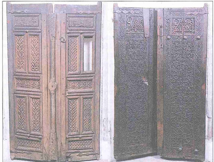
Ahî Elvan Camii'nin kapı ve pencere kanatları (İstanbul Vakıf İnşaat Eserleri Müzesi)

Asya içlerinden Anadolu'ya gelen mu-tasavvıflardan biri olan Ahî Evran, bir müddet Denizli, Konya ve Kayseri'de ikamet ettikten sonra birçok şehir ve kasabayı gezerek ahîlik teşkilâtının kuruluşunda ve yayılışında önemli bir rol oynadı. Sonradan Kırşehir'e yerleşti ve ölü-