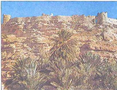
Sakaka Kalesi - Dümetülcendel / Suudi Arabistan

Yâkût Mu'cemü'l-büldân 'da Düme adını taşıyan iki yer daha zikretmektedir. Bunlardan biri Dimaşk yakınında, diğeri Hire'dedir.