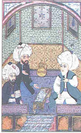
Aşık Çelebi tezkiresinde Ebüssuûd Efendi'yi tasvir eden bir minyatür

"Müftülenâm, şeyhülislâm, sultânü'l-müfessirîn, hâtimetü'l-müfessirîn, muallim-i sâni, allâme-i küll, Hoca Çelebi, Ebû Hanîfe-i Sâni" unvanlarıyla anılır. Ebüssuûd kelimesi onun adı gibi görünmekteyse de tefsirinin mukaddimesinde kendisinden Ebüssuûd Muhammed şeklinde bahsettiği dikkate alınır asıl adının Muhammed, Ebüssuûd'un da bir künye veya lakap olduğu anlaşılır. Bu künyeyi niçin aldığı konusunda kaynaklarda yeterli bilgi yoktur. Ebüssuûd Efen-