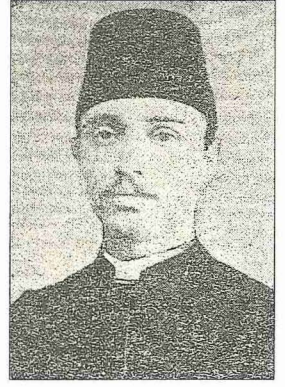
Müştakzâde Edhem Efendi gençlik yıllarında

rildi. Emin Efendi'nin vefatı üzerine dergâhtan ayrıldıktan sonra 1916'da Fetih civarında Kefevî Tekkesi'ne Kâdirî Şeyhi Arap Said Efendi'nin halifesi olarak vekâleten, bir müddet sonra da asâleten tayin edildi ve tekkelerin kapatılmasına kadar (1925) bu görevde kaldı. 1918'deki meşhur Fatih yangınında evi yanınca Çarşamba'daki Murad Molla Tekkesi'nde oturmaya mecbur oldu. 21 Şevval 1351 (17 Şubat 1933) tarihinde vefat etti ve Edirnekapı dışındaki mezarlığa defnedildi.