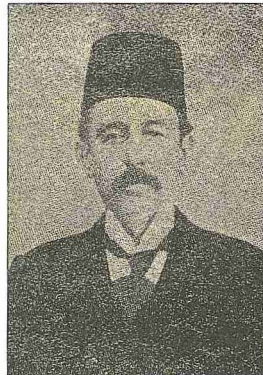
Santürî Edhem Efendi