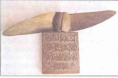
Hezarfen Edhem Efendi'nin Özbekler Tekkesi'nde imal ettiği (1290/1873) buhar makinesinin plakası ve makineye taktığı pervane

Edhem Efendi'nin eserlerinden pek azı, bugün torun çocuklarının oturduğu Özbekler Tekkesi'nde korunmaktadır. Bunların saklandığı dolabın üstüne metni kendisine ait olan, "Nakişlar dolapta saklıdır, bunları yapan da toprakta gömülüdür" anlamındaki Arapça beytin yazdırılmasını vasiyet etmiş, bu vasiyeti ebru talebesinden hattat Aziz Rifâi Efendi tarafından yerine getirilmiştir.