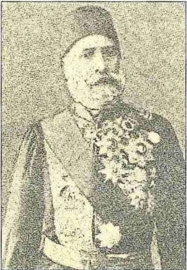
Edhem Pertev Paşa

B) Şiirleri. Edhem Pertev Paşa'nın epeyce şiir yazdığı ifade edilmekteyse de kütüphanesi Koska'daki yangında eviyle birlikte yandığından bunların sadece dokuz tanesi bilinmektedir. Bu şiirlerinin bir kısmı eski tarzın devamıdır ve herhangi bir orijinalliyi yoktur. Türkçeye nazmen çevirdiği Voltaire'den "Münâcât", Rousseau'dan "Bekâ-yı Hayât", Victor Hugo'dan "Tıfl-ı Nâim" adlı şiirler şekil ve muhteva bakımından yenilik