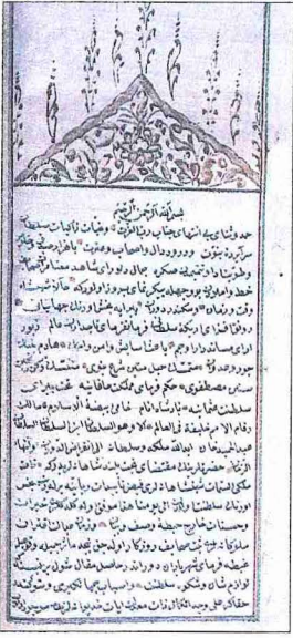
Edib Mehmed Emin'in Tarih-i Edib adlı eserinin ilk sayfası (İÜ Ktp., TY, nr. 3220)

Emin, Tarih , vr. 55 a ). Enverî'den sonra vak'anüvislik ikinci defa Vâsîf'a verilip onun ordu ile sefere gitmesi üzerine de daha önce III. Selim'e kadar İstanbul olaylarını yazan Edib, eksik kalan olayları kaleme almak için yeniden bu göreve tayin edildi ( İA , XIII, 278). Önceki görevi devresinde 9 Cemâziyelâhîr 1202 - 10 Receb 1203 (17 Mart 1788 - 6 Nisan 1789) tarihleri arasındaki hadiseleri kaydeden Edib Efendi, ikinci memuriyeti sırasında 2 Receb 1203 - 26 Muharrem 1207 (29 Mart 1789 - 13 Eylül 1792) arası hadiselerini kaleme aldı. İkinci vak'anüvislik vazifesi sırasında 2 Mayıs 1792'de kendisine teşrifâtçılık hizmeti de verilmişti.