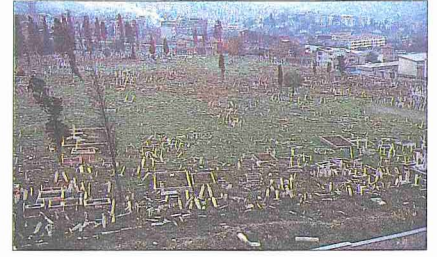
Edirnekâpı Mezarlığı'ndan 1979 yılına ait bir fotoğraf

Edirnekâpı Mezarlığı'nın en bakımlı kısmı, 1926'da kurulan Şehitlikleri İmar Cemiyeti'nin kontrolündeki Şehitlik bölümüdür. Mezarların bir kısmı başka yerlerden nakledilmiş olan Şehitlik, adaları birbirinden ayıran ve büyük muharebe-lerden adını alan caddelerle modern bir