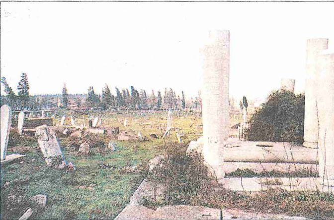
Edirnekapi Mezarlığı'ndan bir görünüş - İstanbul

İstanbul'un en büyük mezarlıklarından biri.