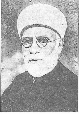
Mehmet Râkım Elkutlu

fesinin dışında hayatının son günlerine kadar bu görevini sürdürdü. Bu sebeple çevresinde Râkım Hoca diye tanındı. 3 Ekim 1946'da kurulan İzmir Türk Müsiki Cemiyeti reisliğine getirildi. 4 Aralık 1948 tarihinde İzmir'de vefat etti ve Kokluca Mezarlığı'na defnedildi. Hisar Camii'nde kılınan cenaze namazı esnasında civardaki açık bir radyodan, Râkım Hoca'nın bayatı makamında bestelemiş olduğu, "Bana hiç yakışmıyor böyle intizâr şimdi / Mâtemzede gönlümde hayat bir mezâr şimdi" mısraları ile başlayan eserinin okunması, namaza katılan cemaatin göz yaşlarını çoğaltan bir hâtıra olarak hâfızalardadır.