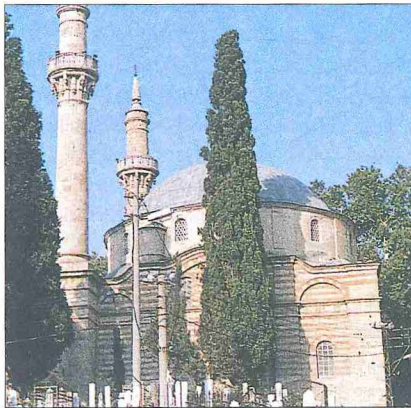
Emîr Sultan Camii - Bursa

Beden duvarlarında üç sıra halinde düzenlenmiş kırk dört pencere ile kubbe kasağındaki on iki pencere harimi aydınlatır. Alt sıradaki demir parmak-