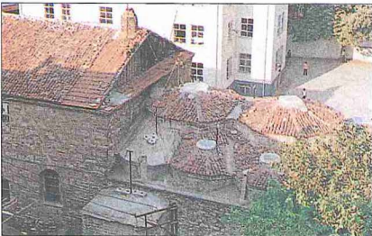
Emir Sultan Hamamı