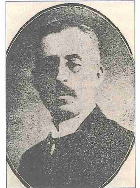
Emir Şekib Arslan

Beyrut yakınında bulunan Şûf kazası-na bağlı Şüveyfât nahiyesinde doğdu. Şûf'un, XVIII. yüzyılın sonlarından itibaren "emir" unvanını alan, Hîre'de hüküm süren Lahmî krallarından Münzir b. Mâ-üssemâ'nın soyundan geldiği söylenen nüfuzlu Dürzî ailelerinden birine mensuptur. Ancak Emîr Şekib, ailesinin Sün-nîliği benimsediğini ileri sürmektedir. Ni-tekim hem kendisi hem kardeşleri Sün-nî eğitimi görmüş ve Sün-nî olarak yaşa-mışlardır. Şekib Arslan altı yaşından iti-baren bir süre Şûf'taki bir Amerikan okuluna devam etti. 1879'da, Beyrut'ta-ki en gelişmiş Mârûnî okulu olan Med-resetü dâri'l-hikme'ye girdi. Özellikle Arap edebiyatı ve tarihi alanında çok iyi yetiştirdi; ayrıca Fransızca öğrendi. 1886 yılında Beyrut'ta Medresetü's-sultâniyye'ye geçti. Burada diğer ilimlerin yanı sıra, o yıllarda Beyrut'ta sürgünde bu-lunan ve Medresetü's-sultâniyye'de öğ-retmenlik yapan Mısırlı âlim Muhammed Abduh'tan fıkıh ve akaid dersleri aldı. Türkçe'yi de burada öğrendi. Ayrıca Ab-duh'un okul dışında yaptığı sohbet top-lantılarına katıldı. 1887'de Şûf'a dönen Şekib Arslan, aynı yıl babasının ölümüyle boşalan Şüveyfât nahiy müdürlüğüne tayin edildi. 1890'da bu görevinden ayr-ılarak gittiği Mısır'da Muhammed Ab-duh'un etrafında oluşan ve fikirlerini ya-yan gruba dahil oldu; Mısır'ın önde ge-len fikir ve kalem erbabı ile tanıştı. Bu