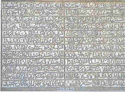
Ertuğrul Gazi Türbesi'nin 1304 (1886-87) tarihli tamir kitabesi

hane niteliğinde bir han ile bir imarethâne inşa edilmiş, ancak bu yapılar günümüze ulaşmamıştır. Başbakanlık Osmanlı Arşivi'ndeki mimari çizimler arasında (Plan, Proje ve Krokiler kısmı, nr. 48) yer alan 30 Receb 1320 (2 Kasım 1902) tarihli bir belgede, Ertuğrul Gazi Türbesi'ni ziyaret amacıyla Söğüt'e gelen Karakeçili aşireti mensuplarının ikametlerine mahsus olmak üzere inşa edilecek bir hanın planı bulunmaktadır. II. Abdülhamid'in, Ertuğrul Gazi'nin mensup olduğu Karakeçili aşiretinden muhafız alayları tertip etmesi gibi Söğüt'te gerçekleştirdiği bu tamirat ve inşaat faaliyetleri de hânedanın Anadolu'daki köklemeyle olan bağlantısını canlandırma arzusunun yöneliktir. Karakeçililer'in Ertuğrul Gazi'nin hâtrasına duydukları bağlılık günümüzde de sürmekte ve eskiden beri her yıl eylül ayının sonlarında yapılan Ertuğrul Gazi ihtifali gittikçe resmî bir nitelik kazanarak daha coşkulu bir hal almaktadır. Aşiret mensupları, ihtifal sırasında Söğüt'ün doğusunda bulunan "Dua Yeri" adındaki yüksek düzlükte toplanıktan sonra geleneksel kıyafetleri içinde ellerindeki sancaklarla kasabaya girmekte ve at üzerinde türbeyi üç defa tavaf etmektedirler. Arkasından kurbanlar kesilmekte ve bunların etleriyle hazırlanan pilâv topluca yenildikten sonra Kur'an ve mevlid okunup cirit gibi millî oyunlar sergilenmektedir.