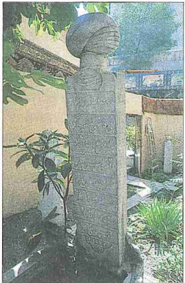
Sahaflar Şeyhizâde Esad Efendi'nin mezar taşı - Çağaloğlu / İstanbul

di. Bir yıl kadar sonra gerek meclisin görüşüyle hareket etmek istememesi, gerekse hastalıklı bir bünyeye sahip olmasını bahane ederek bu görevinden istifa etti. Bunun üzerine 26 Aralık 1847 tarihinde mevkii daha yüksek, meşguliyeti daha az olan Meclis-i Maârif-i Umûmiyye reisliğine getirildi. Bu onun son görevi oldu. Rahatsızlığı giderek artan Esad Efendi 4 Safer 1264 (11 Ocak 1848) tarihinde vefat etti. Cenazesi ertesi gün devrin ileri gelenlerinin iştirakiyle Sultan Ahmed Camii'nde kılındı ve İstanbul'da Yerebatan'da yaptırdığı kütüphanenin bahçesine gömüldü.