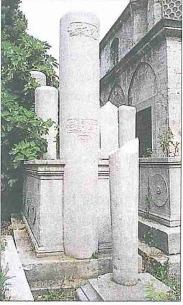
Hocazâde Esad Efendi'nin Abdülkadir Efendi Mescidi hazîresindeki mezarı - Eyüp / İstanbul

reketlerine elinden geldiği kadar karşı koymaktan çekinmemiş, ancak olaylardan anlaşıldığına göre şahsî hislerine kapılmaktan da kendini alamamıştır. Onun edebiyatla yakından ilgili olduğu, Türkçe ve bilhassa Arapça, Farsça şiirler yazdığı bilinmektedir. Babası Hoca Sâdeddin Efendi'ye bazı Arapça eserlerinin tercümesi hususunda yardım etmiştir. Esad Efendi'nin Taczâde Mehmed Efendi'den sülûs ve nesih meşketiği de bilinmektedir (Müstakimzâde, s. 445).