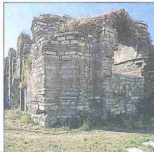
Esekapısı Mescidi ve Medresesi'nin kalıntıları - Cerrahpaşa / İstanbul

Esekapısı Mescidi Mehmed Ziyâ, M. Alpatoff ve N. Brunoff gibi araştırmacılar tarafından incelenerek, yapının 1920'lerdeki durumunu anlatan makaleler yayımlanmıştır. 1930-1960 yıllarında mescid çok haraptı; yıkılmaya bırakılmış olan medrese ise son derece bakımsız halde