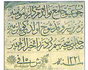
Eskicuma Saat Camii'nin kitabesi

XVII ve XVIII. yüzyılın başlarında kazadaki hıristiyan köylerinin dokuzundan yedisi kısmen ihtidâlar, kısmen de kasabaya ve Vardun köyüne vâki göçler neticesi tamamıyla İslâmîleşti. Buna karşılık kazadaki otuz yedi müslüman köyünde başka bir gelişme görüldü ve bu köylere hıristiyan nüfus yerleşmeye başladığı gibi mevcut hıristiyan nüfusta da artış meydana geldi. 1290 (1873) tarihli Salnâme-i Vilâyet-i Tuna 'ya göre Işıklar, Dalgaç, Elvanköy ve Yavaşköy'de nüfusun çoğunluğunu hıristiyanlar oluşturuyordu. Kasaba ve köylerdeki bu deği-