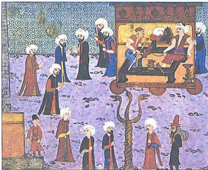
Sehzade Mehmed'in sünnet şenliğinde (1582) mumcu esnafının resmî geçidini gösteren minyatürden detay ( Surnâme-i Hümâyün , TSMK, Hazine nr. 1344, vr. 159 a )

Esnaf Tekelleri. Esnaf sistemi XIX. yüzyılın ikinci yarısına kadar esnafa tanınan tekel haklarına dayanıyordu. XVIII. yüzyılın ikinci yarısından itibaren esnaf bu haklara dayanarak piyasa fiyatlarını tekel altına almış ve fiyatları yükseltmeye başlamıştı. Dışa kapanarak artık iktisadî hayata zarar vermeye başlayan esnaf tekellerinin fiyatları belirlenen narhların üstüne çıkmıştı. Esnaf sistemini bozucu yöndeki bu gelişmeleri yakından takip eden devlet, fiyat yükselişlerinin sebebinin esnaf tekelleri olduğu