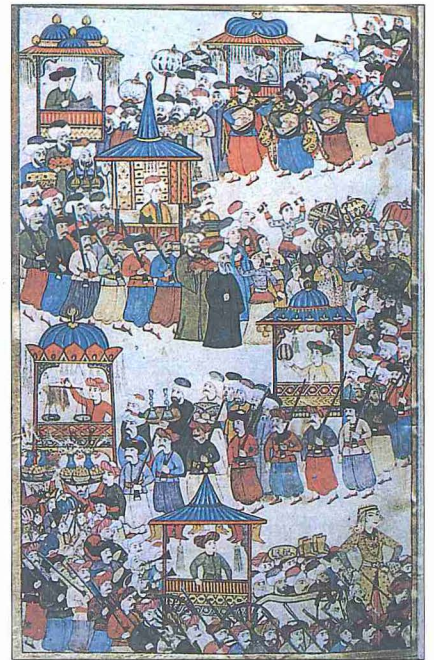
Levni'nin esnaf loncalarının resmigeçidini gösteren bir minyatürü ( Surnâme-i Vehbî , TSMK, III. Ahmed, nr. 3595, vr. 108 a )