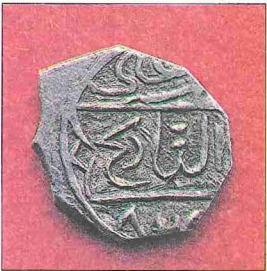
Beşşehir'de Eşrefoğulları'ndan Süleyman b. Mehmed adına basılmış gümüş sikke (İstanbul Arkeoloji Müzesi, Teşhir, nr. 1336)

kan saltanat boşluğu sırasında Keyhusrev'in annesi tarafından saltanat nâibliğine getirildi. Ancak II. Gıyâseddin Mesud'un Konya'da duruma hâkim olması üzerine kendi merkezi olan Gorgorum'a (Gurgurum-Gökçimen) döndü.