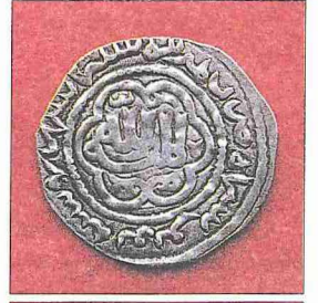
Beşşehir'de (Süleymanşehir) Alâeddin Keykubad adına basılmış 699 (1299) tarihli gümüş sikke (İstanbul Arkeoloji Müzesi, Teşhir, nr. 1177)

İlhanlı Devleti'ndeki hükümdar değişikliğinden ve II. Mesud'un Kayseri'ye gitmesinden faydalanan uç Türkmenler'i yeniden ayaklandılar. Eşrefoğlu topraklarına saldıran Karamanoğulları karşılaştıkları şiddetli direniş üzerine geri çekilmek zorunda kaldılar. Bu karışıklıklar başa çıkamayan II. Mesud, İlhanlı Hükümdarı Geyhatu'yu Anadolu'ya çağırarak zorunda kaldı. Kuvvetli bir orduyla Anadolu'ya gelen Geyhatu Lârende (Karaman), Ereğli, Beşşehir ve yöresinde büyük bir katliam ve yağma hareketinde bulunmuş ve 7000 kişiyi esir alarak Konya'ya götürmüştür. Fakat Haziran 1292'de Geyhatu'nun Tebriz'e dönmelerinden, II. Mesud'un da kardeşinin saltanat iddiasıyla Kastamonu civarında ayaklanmasıyla meşguliyetinden faydalanan Karamanlılar Konya'ya saldırmışlar, Eşrefoğlu Süleyman Bey de Gevele