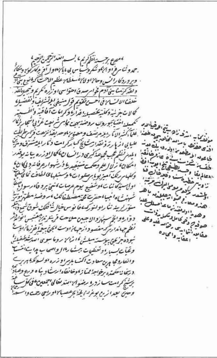
Eşrefzâde Ahmed Ziyâeddin'in Gülzâr-ı Sulehâ ve Vefeyât-ı Urefâ adlı eserinin ilk ve son sayfaları (Bursa Yazma ve Eski Basma Eserler Ktp., Orhan Gazî, nr. 1018/11)

hibi amcası Abdülkâdir Necib Efendi'nin yanında tamamladı. Yâkubefendizâde Nûri'nin çocuksuz olarak vefatı üzerine Setbaşı'ndaki Çarşamba Dergâhı'nın şeyhliğine getirildi. Tekke şeyhliği yanında Emîr Sultan Camii'nin cuma vazîliği görevini de yürüten Ahmed Ziyâeddin genç yaşta vebadan öldü ve Eyüp Efendi Tekkesi mihrabı önüne defnedildi.