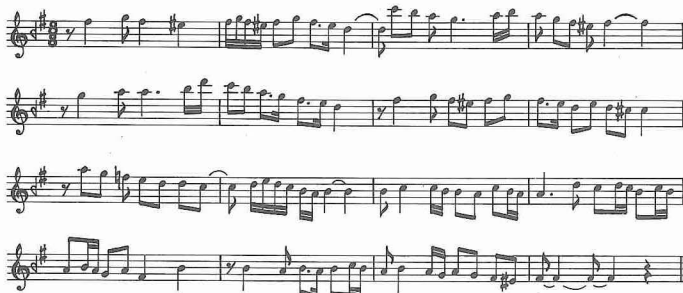
Evîç makamı seyir örneği

Evîç Makamı. Türk müzikisinin en eski makamlarındandır. Dizisi, evîç perde-