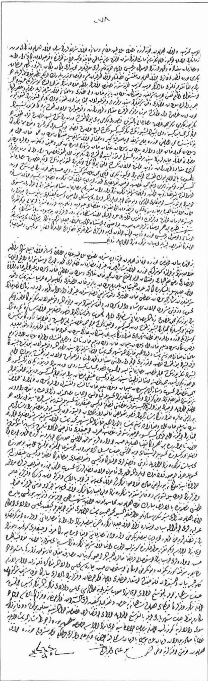
Mart 1258 - Şubat 1260 (Mart 1842 - Şubat 1845) tarihleri arasında geçen üç yıllık süredeki selâtin vakıflarının gelir gider durumunu gösteren 5 Şevval 1262 (26 Eylül 1846) tarihli belge (VGMA, nr. 1262; 967/278)

Evkâf-ı Hümâyun Nezâreti'nin taşra teşkilâtı, yerleşim birimlerinin büyüklüğüne ve o yörede bulunan vakıf potan-