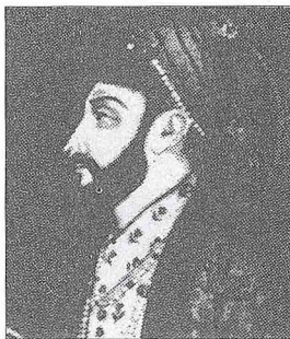
Evrengzîb'i tasvir eden bir resim (ML, IV, 459)

Evrengzîb'in aktif siyasî hayatı, 1635'te Cüchâr Singh Bundelâ'ya karşı gerçekleştirilen başarılı bir seferle başladı. Ertesi yıl 1644'e kadar yürüttüğü Dekken valiliğine tayin edildi. Ardından Gucerât valiliğine getirildi. Valilikte iki yıl kaldıktan sonra 1646'da Belh'e gönderildi. Evrengzîb Belh'te başarılı olmadı ve yerini Nazar Muhammed Han'a bırakmak zorunda kaldı. 1646-1647 yıllarında Özbekler ve Safevîler'e karşı düzenlenen seferlerde orduya başarılı bir şekilde komanda etti. 1648'de Mültan valiliğine getirildi. Bu sırada Şah Cihan ondan Kandehar'a sefer yapmasını ve şehri İranlı-