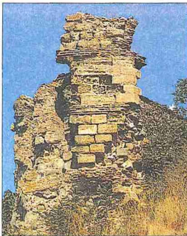
Marmara Ereğlisi'nde eski sur kalıntıları

Milâttan önce 599'da Trakya ve ardındaki ülkelerle ticaret yapmak için Sisamlılar tarafından kurulan ve eski adı Perinthos olan bu liman şehrine IV. yüzyıldan itibaren Herakleia, öteki Herakleialar'dan ayırmak için de Herakleia Thraciae (Trakya Ereğlisi) denmeye başlandı. Ortaçağ'da bu liman şehrinin ehemmiyeti daha da arttı. Burası Bizans'ın önemli şehirleri arasında bulunuyor ve Venedikliler'in Bizans'la olan ticaretinde büyük bir yer tutuyordu. 1204 yılında İstanbul Haçlılar'ın eline geçince Marmara kıyıları bir anlaşma çerçevesinde Bizans'la Haçlılar arasında paylaşıldı. Bunun sonucunda Ereğli Haçlılar'ın payına düştü. Venedikliler bu şehri uğrak yeri olan bir iskele ve Trakya'nın zengin ovalarının ürünü olan buğdayın bir ihrâç kapısı olarak kullandılar.