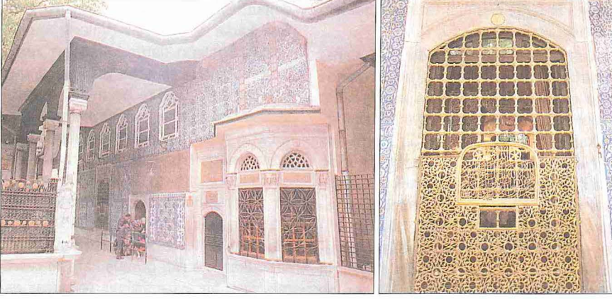
Eyüp Sultan Türbesi ile hâcet penceresi

İsyanı sırasında sancak-ı şerifin âsilerin ellerine geçmemesi için saraya alınarak Hırka-i Saâdet Dairesi'ne konulduğundan günümüzde yalnız kılıfları durmaktadır. I. Abdülhamid 1200'de (1786) kapı ve pencere kanatlarını yenilemiş, II. Abdülhamid de tunç kapı kanatları önüne kendi eliyle yaptığı sedef kakmalı parmaklıklı kanatlar koydurmuştur. Türbenin içindeki sandukanın etrafını III. Selim dönemine ait 1207 (1792-93) tarihli gümüş bir şebeke çevirir: "...Yazdı itnâ-mına târîh Münib / Pâk-vâlâ eser-i Şâh Selîm" (1207). Sanduka örtüsü de II. Mahmud tarafından konulmuş, üstündeki simle işlenmiş yazılar Mustafa Râkım Efendi'nin hattıyla yazılmıştır. Türbenin içinde ayrıca padişahların birçoğunun ve ünlü hattatların kaleminden çıkmış değerli levhalar bulunmaktadır.