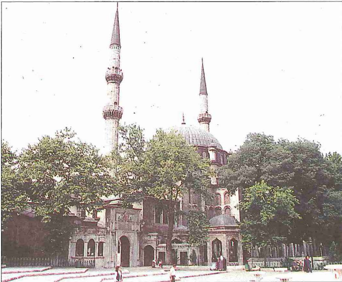
Eyüp Sultan Camii - Eyüp / İstanbul

III. Selim'in yaptırdığı cami ise bütünüyle değişik bir düzene sahiptir. Türbe