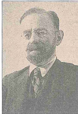
Mehmet Suphi Ezgi