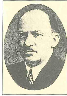
Muhlis Sabahattin Ezgi

Muhlis Sabahattin Ezgi sahne eserlerini 1917-1920, 1921-1935 ve 1936-1942 yılları arasında olmak üzere üç devreye ayırmıştır. Bunlar arasında ilk dönem eserlerinden Çâresâz ile ikinci dönemde bestelediği Gül Fatma ve bilhassa Ayşe operetleri çok tutulmuştur. Güftelerinin birçoğunu kendisinin yazdığı, bir kısmı hayatta iken plağa alınan eserlerinde daha çok Türk müzikisi makam ve usul-