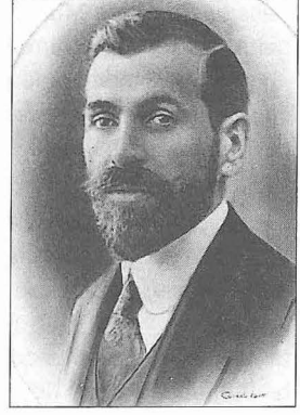
Faik Âli Ozansoy