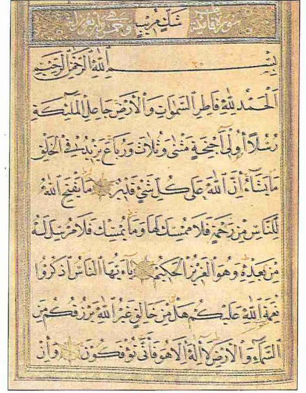
Fâtır sûresinin nesih hattıyla yazılmış ilk âyetleri

"Yarmak, kabuğunu yarıp ortaya çıkarmak, yaratıp ortaya çıkarmak" anlamın-