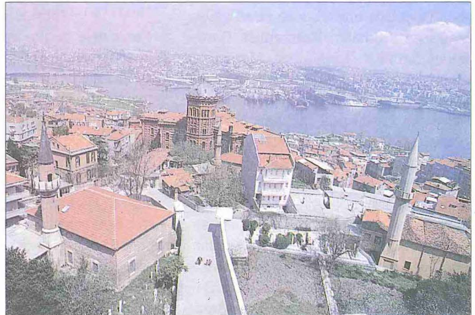
Fener semtinin Haliç'e doğru görünüsü - İstanbul

Oldukça sık yangın geçirmiş olan Fener'de her yangından sonra yeniden yapılaşma sürecinde mahalleler kurulurken gerçekleştirilen ön planlamalarla, dik açılarla birbirini kesen bir sokak örgüsü ve surların arkasında şehrin en düzenli mahalle dokularından biri oluşmuştur. Sahilde Rum asilzadelerine ait Fener evlerinin günümüze kadar gelebilmiş olan son örnekleri, bu arada Venedik balyosunun evi olarak bilinen yapı, 1985 yılındaki Haliç kıyı şeridini yeniden düzenleme çalışmaları sırasında ortadan kaldırılmıştır. Osmanlı sivil mimarisinin özgün örneklerinden olan bu binalar, İstanbul'un diğer semtlerinde gelişen ahşap mimariye tam bir tezat oluşturan taş yapılarıdır. Kalın duvarlar, iri demir parmaklıklar ardında küçük pencereler, tersine çevrilmiş merdiveni andıran konsollar üzerinde taşınan cumbalar, kemerli kapılar Fener evlerini karakterize eden mimari unsurlardır. Bu evler iki veya üç katlıydı ve her kat bir-