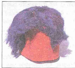
XIX. yüzyılın ikinci yarısına ait püsküllü dağılmış bir fes (TSM, nr. 13/2133)

Fes Türk kültür tarihinde önemli bir yere sahip olup şarkılara, türkülere girmiştir. Devrin şair ve edipleri eserlerinde eğri giyilen, kaşa düşürülen feslerden bahsetmişler, çocuk feslerine nazarlık, muska ve ziynet altını takıldığını yazmışlardır. Başta fes olmadan fotoğraf çektiğimizin ise ayp sayıldığı söylenir. Fesin süsünü oluşturan ve ona özellik kazandıran püskül üzerinde de epeyce söz söylenmiştir. II. Mahmud devrinin bükülmemiş ipekten bol mavi iplikli püskülü başın hareketi veya rüzgâr sebebiyle sık sık dağılıyordu ve taşıyana derbeder bir görünüş veriyor, sık sık taraması, düzeltilmesi gerekiyordu. Bu püskülleri taramak için çarşıda, sokaklarda küçük çocuklar ellerinde taraklarla dolaşır ve para kazanırlardı. Böylece püskül onu taşıyanın başına dert olmuştu. "Püsküllü belâ" deyiminin, henüz fesin tam anlamıyla benimsenmediği, yalnız asker arasında zorunlu tutulduğu dönemde buradan kaynaklanmış olması muhtemeldir. Nitekim Lutfi, 1261 (1845) yılı olayları arasında bir püskül nizam-nâmesinin çıkarıldığından ve bununla bütün askere, ayrı ayrı gösterilen dirhemler miktarında örme (bükülmüş) püskül takmaları, feslerinin tepesine "ferahî" koymaları mecburiyetinin getirildiğinden ve aynı şekilde diğer fes giyenlerden de örme püskül kullanmalarının istendiğinden bahseder. Ferahî ince pirinçten yuvarlak bir levhadır. Püskül takılıp tablaya düzenli bir şekilde yayıldık-