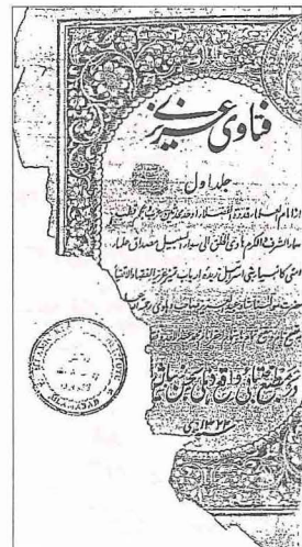
Fetâvâ-yı 'Azîzî'nin I. cildinin kapağı (Delhi 1322/1905)

Abdülazîz ed-Dihlevî'nin İngiliz işgali altındaki Hindistan topraklarını dârül-harp ilân eden fetvası en çok tartışılan fetva olmuştur ( Fetâvâ-yı 'Azîzî , I, 17, 33