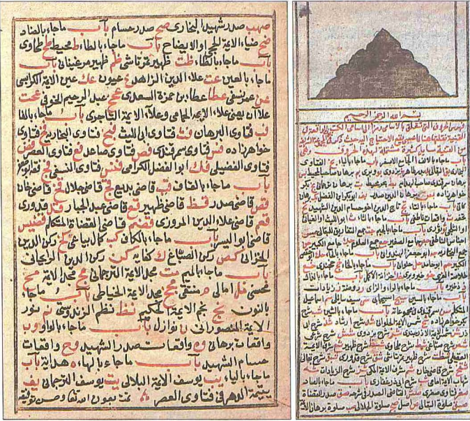
Fetâvâ-yı Ankaravî'nin ilk iki sayfası (Süleymaniye Ktp., Serez, nr. 1155)

ları da (meselâ yol kesme) bu bölümde yerleştirilmiştir.