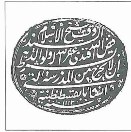
Seyyid Feyzullah Efendi'nin vakıf mührü

Tarihlere Edirne Vak'ası veya Feyzullah Efendi Vak'ası adıyla geçen bu isyan önce İstanbul'da başladı, daha sonra Edirne'ye sıçradı. Edirne'de bulunan Şeyhülislâm Feyzullah Efendi ve ondan sonraki şeyhülislâm adayı oğlu Nakîbüleşraf Fethullah Efendi görevlerinden alındılar (13 Rebülevvel 1115/27 Temmuz 1703). Feyzullah Efendi kaçmaya çalışırken Pravadi'de yakalanarak yarı çıplak vaziyette Edirne'ye getirildi. Feci işkenceler sonunda oğlu ile birlikte Batpazarı'nda çırılçıplak bir halde uyuz bir hamal beygirine bindirilip türlü hakaret-