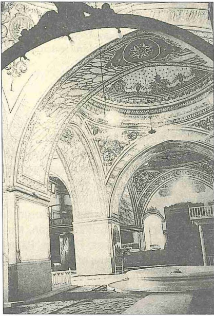
Hüdâvendigâr Camii'nin içinden bir görünüşü - Filibe / Bulgaristan

merdivenciler, berberler, ayakkabıcılar ve dokumacılar vardı. Sofya'da bulunan 1576 tarihli Celepkeşan Defteri 'nde 1568 tarihli Tahrir Defteri 'nde zikredilmeyen beş tüccarla dört ipek tüccarı, bazı kuyumcular ve kürkçülerin varlığına rastlanmaktadır. Bu son tarihte Filibe'nin otuz üç müslüman, beş hıristiyan, bir yahudi ve bir de Çingene mahallesi olduğu görülmektedir. Şehirdeki müslüman nüfusunun sadece % 4,6'sı yerli halktandı (TK, TD, nr. 65; BA, TD, nr. 648). XVII. yüzyılın ilk yıllarından itibaren Filibe'de kendilerine ait kiliseleri olan Roma Katolik Kilisesi'ne bağlı bir Bulgar cemaati mevcuttur.