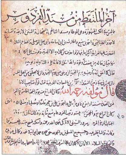
İbn Hacer'ın el-Mülteka't min Mûsne'di'l-Firdevs adlı eserinin IV. cildinin son sayfası (Süleymaniye Ktp., Yenicami, nr. 201)