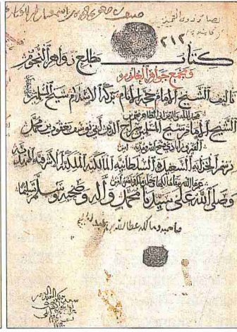
Firüzâbâdî'nin Maṭla'ü zevâhiri'n-nücüm ve mecma'u cevâhiri'l-ülüm adlı eserinin unvan sayfasıyla son sayfası (Köprülü Ktp., nr. 212)