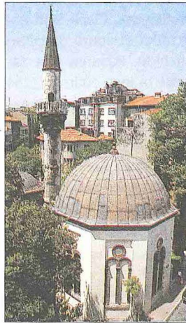
Fuad Paşa Camii - Sultanahmet / İstanbul

Caminin yanında küçük bir hazîre bulunmaktadır. Burada ilk caminin kurucusu olan Uzun Şücâ'nın XVIII. yüzyıla ait olduğu tahmin edilen mezar taşı yer alır. Ayrıca 1277'de (1860-61) vefat eden Mehmed Şükrü Efendi adında bir hattat da burada yatmaktadır. Diğer mezar taşlarının en eskisi ise 1219 (1804-1805) tarihlidir. Yine caminin yanında Fuad Paşa'nın sekiz köşeli ve kubbeli türbesi bulunur. Türbenin dış yüzeyleriyle garip biçimli pencerelerinin şebekeleri Türk sanatına yabancı bir üslûpta bezemiştir.