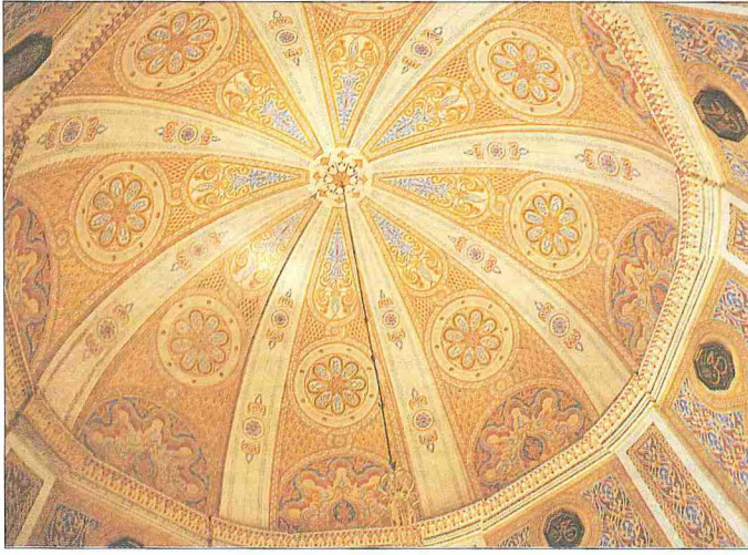
Fuad Paşa Camii'nin kubbe içindeki kalem işleri