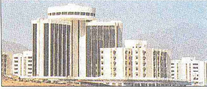
Füceyre'de Milletlerarası Ticaret Merkezi binaları - Birleşik Arap Emirlikleri

bir dostluk antlaşması yaparken kendisine bağlı Menâme yerleşim merkezini Acmân şeyhliğine verdi; Kelbâ ve Re'sülhayme şeyhlikleriyle de evlilik yoluyla akrabalık kurdu. Uzun süre Şârîka ile Füceyre arasında bir problem çıkmadı. Ancak 1925 yılı başlarında cereyan eden küçük bir olay siyasî krize sebep oldu. Şârîka ile Füceyre arasındaki anlaşmazlık İngiltere'nin Füceyre'ye müdahalesiyle yatıştırıldı. Fakat Füceyre'nin Şârîka'dan ayrılma isteği son bulmadı.