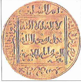
Gâlib - Billâh tarafından bastırılan bir dinar (Musée du Batha, Fez, nr. 52-2-1)

meyi hedef edinmişti. Başlangıçta Mağrib sultanlarına bağlıydı ve uzak görüşlülüğü, zekası ve liyakatiyle Endülüs'te Muvahhidler idaresini yeniden ihya etmekte olan bir lider görüntüsü verdi. Bu sebeple onlar tarafından tanındı, yardım ve destek gördü. 636 (1238-39) yılında Muvahhidler'den Abdülvâhid er-Reşid'e biat etti. 637'de (1239-40) bu biatını yeniledi. Bu durum Abdülvâhid er-Reşid'in 640'ta (1242) ölümüne kadar devam etti. Onun ölümünden sonra bu defa hutbeyi Hafsî Sultanı I. Ebû Zekeriyâ Yahyâ adına okuttu. Bunun üzerine sultan cihada destek vermek maksadıyla kendisine çok miktarda yardım gönderdi.