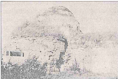
Gazi Mihaloğlu Mahmud Bey Camii'nin 1966 yılındaki hali

405'te (1015) Ecmîr'de doğdu. Asıl adı Sâlâr Mesud olup halk arasında Gazi Miyan olarak tanınır. Ziyâeddin Berenî'ye göre Gazneli Mahmud'un ordusunda askerdi; ayrıca sultanın yakını olduğu da söylenmektedir. Abdülkâdir Bedâûnî onun Afgan asıllı olduğunu belirtir. Bâbürlü Hükümdarı Cihangir döneminde (1605-1627) yazılan Mir'ât-ı Mes'ûdî 'de Gazi Miyan'la ilgili bütün rivayet ve menkıbeler bir araya getirilmiştir. Eldeki bilgilere göre Gazi Miyan'ın Hindis-