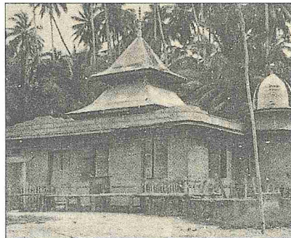
Simunul adası Tubig-Indangan'da Mahdûm Kerîm'e nisbet edilen XIV. yüzyıla ait cami - Filipinler

1718'de Cizvit papazlarının baskısıyla Zamboanga Kalesi'ni zapteden İspanyollar, bölgedeki datuların ve halkın hıristiyan olmasına kolaylık sağlayacağını düşünerek Maguindanao ve Sulu sultanlarını hıristiyan yapmayı planladılar. Sonuçta Maguindanao sultanını hıristi-