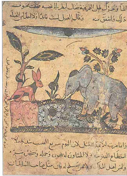
Kellile ve Dimne adlı eserde fil tasvirli bir minyatür (Bidbay, Kellile ve Dimne , Paris Bibliothèque Nationale, MS. Arab, nr. 3467, vr. 71 a )

Filin derisi süs eşyası (bk. FİLDİŞİ), kalın derisi de kalkan yapımında kullanılıyordu. İbnü'l-Baytâr, fil vücudunun bazı kısımlarından tabâbette faydalanıldı-