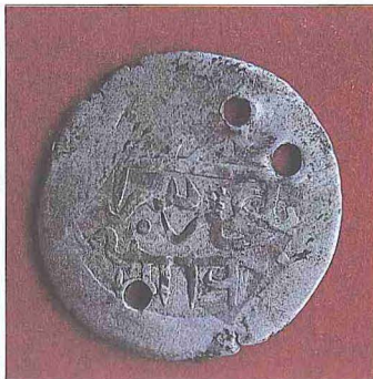
Gazi Giray adına Bahcesaray'da basılan bir gümüş sikke (İstanbul Arkeoloji Müzesi, Teşhir, nr. 2364)