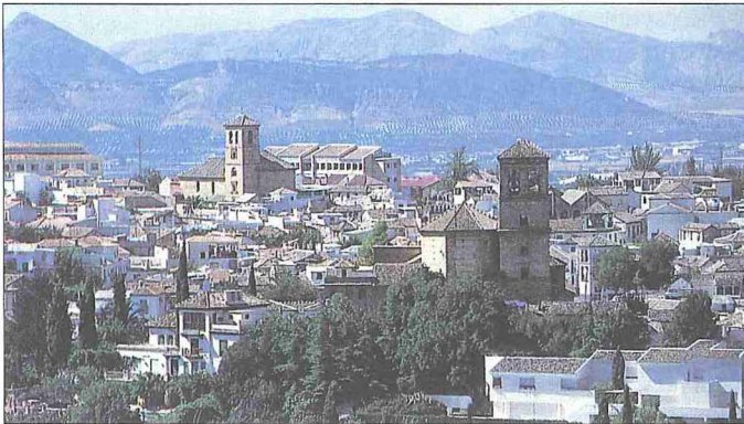
Granada'dan (Gırnata) bir görünüş - İspanya

Gırnata, 403 (1013) yılında Zirîler'in buraya yerleşmesiyle birlikte gerçek anlamda bir Endülüs şehri görünümünü kazanmaya başladı. Zâvî b. Zirî tarafından merkez olarak seçilen Gırnata'nın nüfusu İlbîre'den gelen göçlerle kalabalıklaştı ve etrafı yeni iskân alanlarını da içine alacak şekilde surlarla tahkim edildi. Surların Darro'nun sağ ve sol kıyılarındaki uzanan kısımları, nehrin üzerine iki kule arasında inşa edilen ve bugün Al-